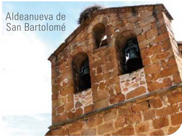
Aldeanueva de San Bartolomé