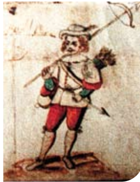
Asaltos en el Camino de Guadalupe