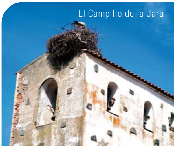
El Campillo de la Jara